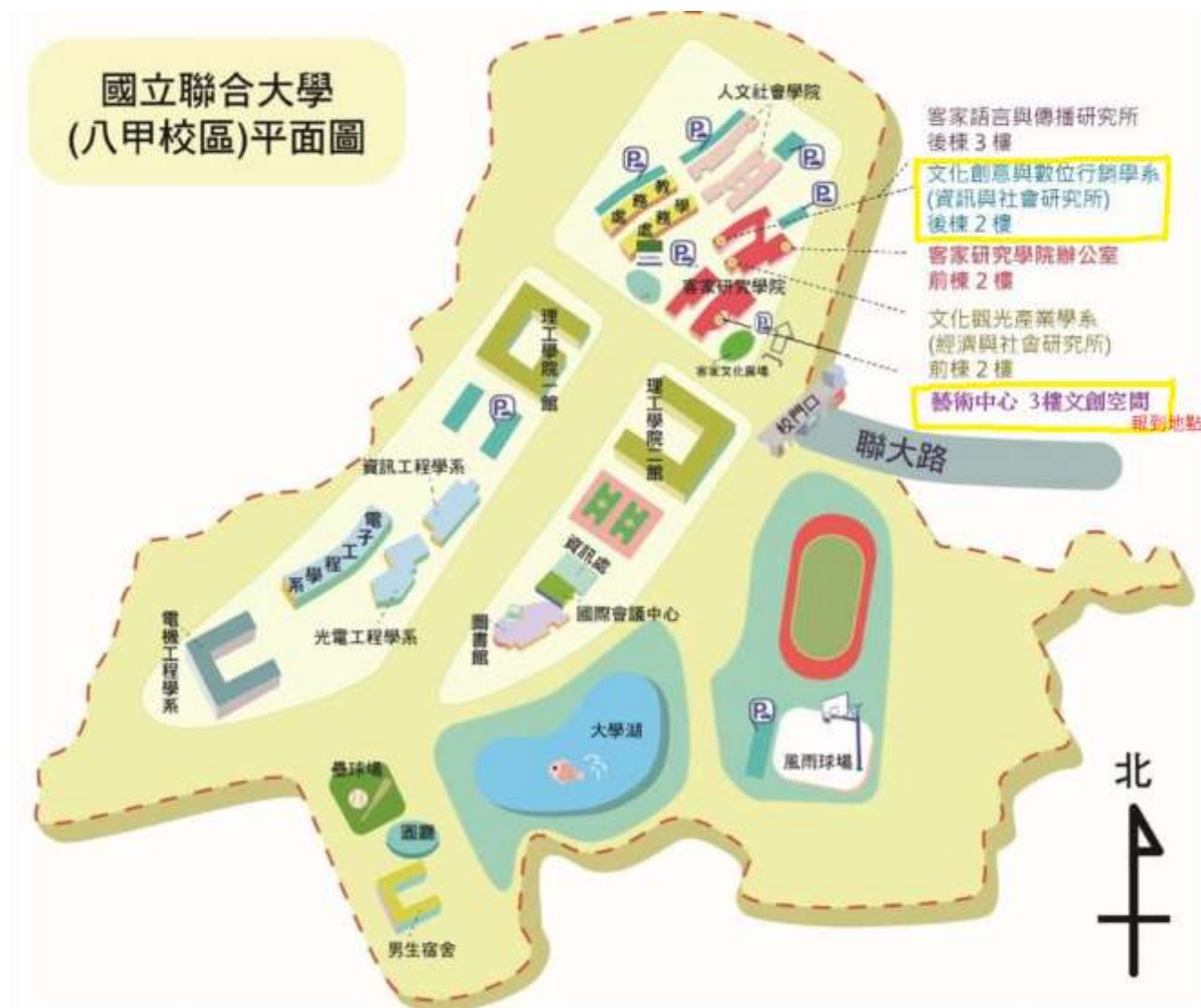
聯合大學八甲校區平面圖